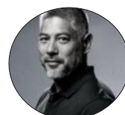
Gabriel KO BioKortex